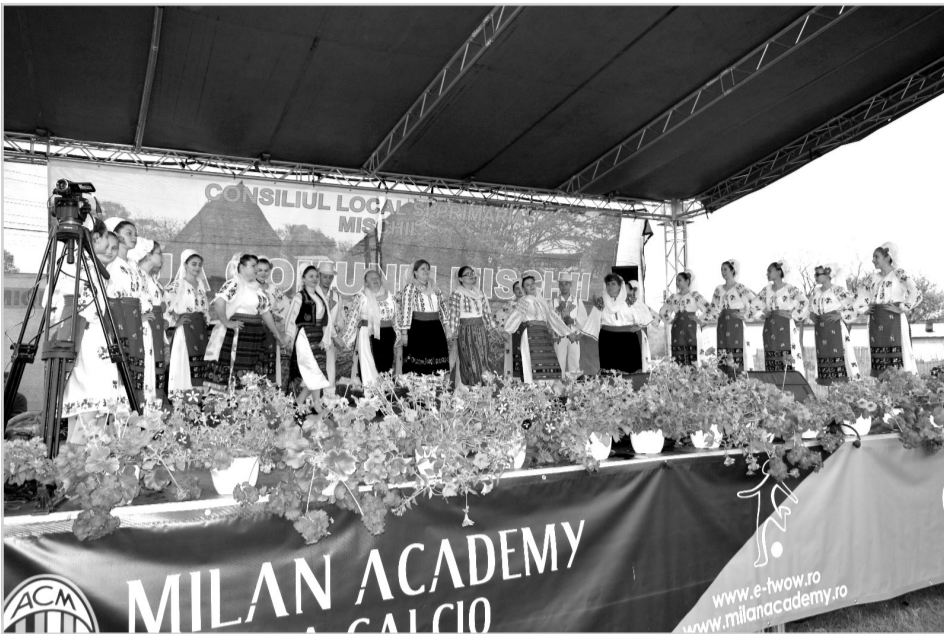
Localnicii din Mischii au fost încântați de reprezentația Ansamblului folcloric Doina Mischiului