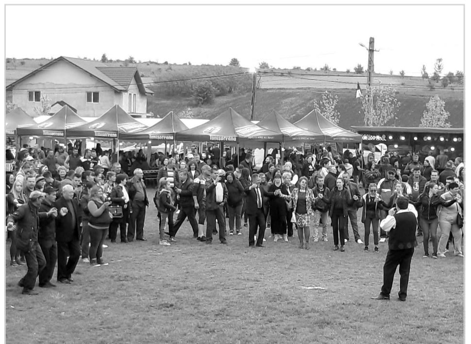
Oamenii s-au adunat la spectacol încă de la orele prânzului