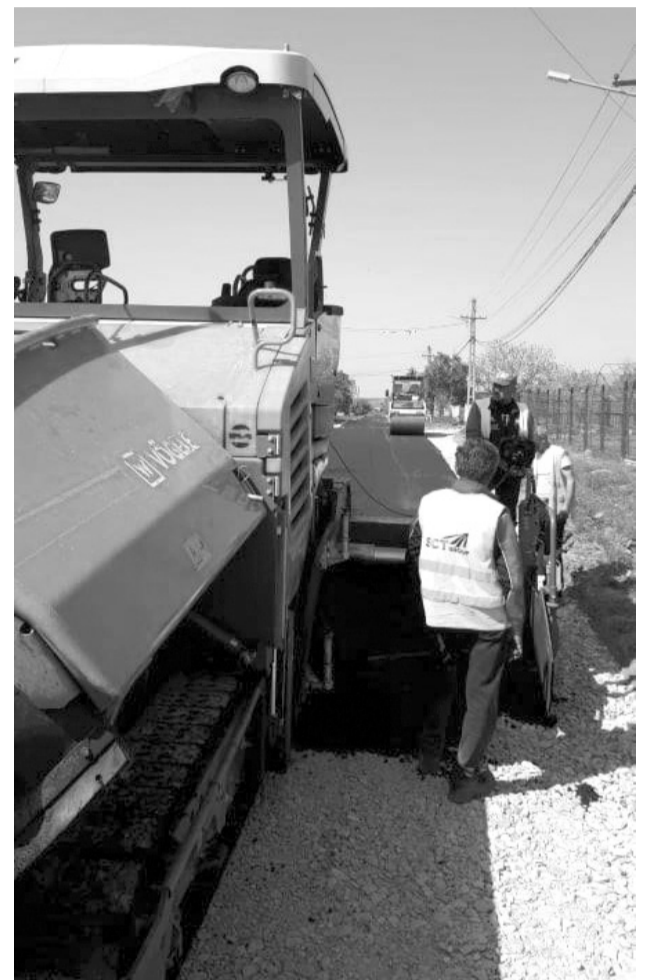
A început asfaltarea străzilor din Mischiu

G.P.: Prețurile terenurilor sunt foarte mici în comparație cu alte comune. De exemplu, la Cârcea, lângă Ford, este 40-50 de euro/mp, la Selgros - la Malu Mare - 20-25 de euro, în condițiile în care nu beneficiază de toate utilitățile. La Mischiu, terenul nu sare de 15 euro/mp. Cu cât suprafața crește, prețul scade, adică la un lot de 1.000 metri prețul scade sub 10 euro/mp. Se poate cumpăra teren și cu 7-8 euro/mp cu acces la toate utilitățile. Și vorbim de teren intravilan. Nu avem poluatori, nu avem firme care să facă zgomot. Îmi doresc ca Mischiul să devină și mai atractiv, având în vedere utilitățile, infrastructura și aspectul.