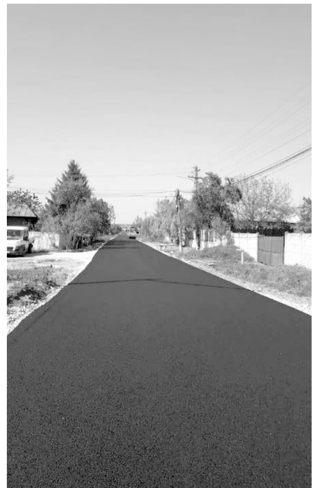
Până la sfârșitul anului 2019, toate străzile din Mischiu vor fi asfaltate