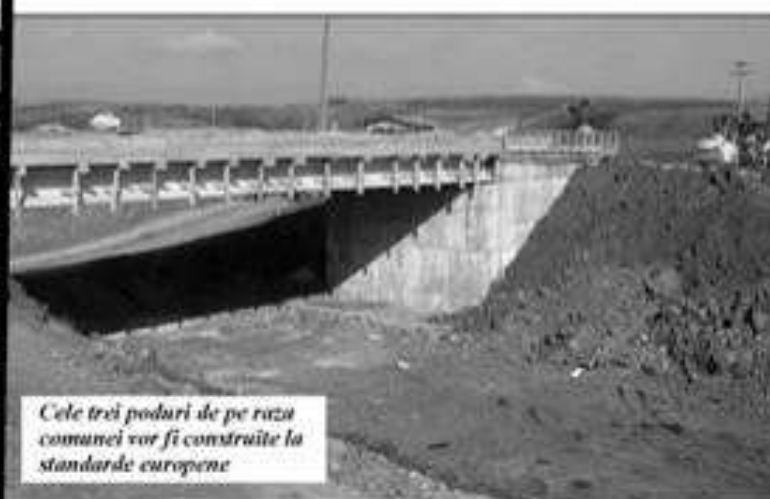
Cele trei poduri de pe raza comunei vor fi construite la standarde europene