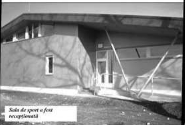
Sala de sport a fost recepționată