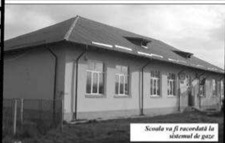
Scoala va fi racordată la sistemul de gaze