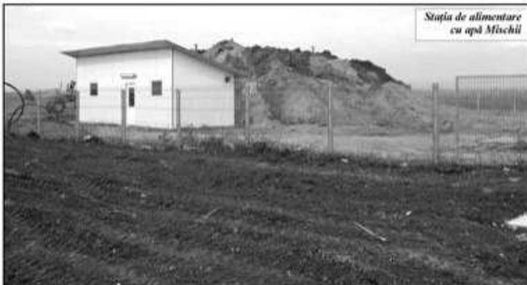
Stația de alimentare cu apă Mischii

De altfel, foarte multe persoane au început deja să efectueze săpăturile aferente și chiar să-și amenajeze singuri căminele de racord. „Cu cât vor fi mai mulți cetățeni care se vor racorda la rețeaua de apă, cu atât prețul pentru metru cub va fi mai mic. Tariful este situat în jurul sumei de 2 lei pentru 1.000 de litri de apă consumați. Este un preț foarte mic. Cât despre cei care nu se vor racorda, aceștia vor trebui să plătească apa la paușal, pentru consumul strădal”, a declarat edilul șef.